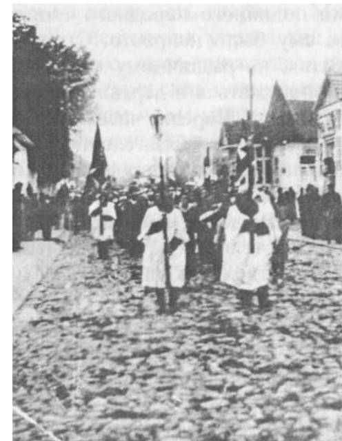
Похоронная процессия (1938 г.)