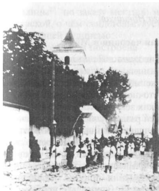
Похоронная процессия (1938 г.)