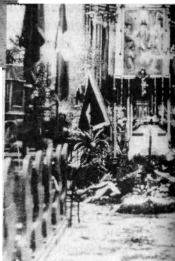
Похороны князя Михаила Святополк-Мирского (1938 г.)